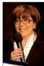
Margherita Rimi Era farsi - Marsilio Editori