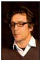
Marco Franzoso Il bambino indaco - Einaudi