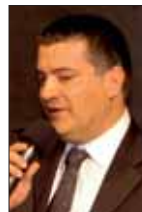
Gianfranco Iovino Oltre il confine - Sassoscritto